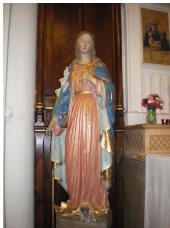
Statue de Philippa de Chantemilan dans l'église de Changy

à la main droite, la main gauche sur son cœur, et au dessous on lit cette inscription : B. Philippa, ORA PRO NOBIS . NÉE A CHANGY, 1401. Effectivement, nous aimons à nous représenter cette vierge chrétienne revêtue de sa robe, pressant sur son cœur, d'une main, l'image de son divin sauveur, le crucifix, et tenant de l'autre main un beau lis blanc, symbole de sa virginité (voir statue de Philippa).