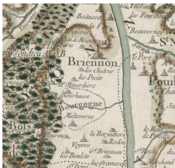
Seigneurie de Maltaverne (Mala Taberna), enclave du duché de Bourgogne, vers Briennon (Carte Cassini)